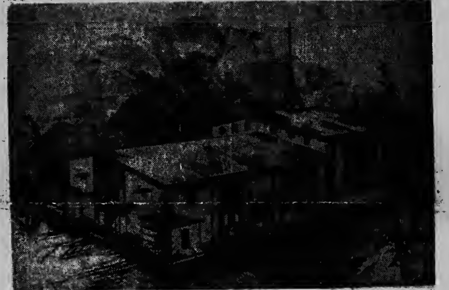
E schets aki di e misa nobo di Fatima pa Dakota hende lo por aprecia na e ferla na Tharcisius College. Un proyecto moderno y di boa gusto.